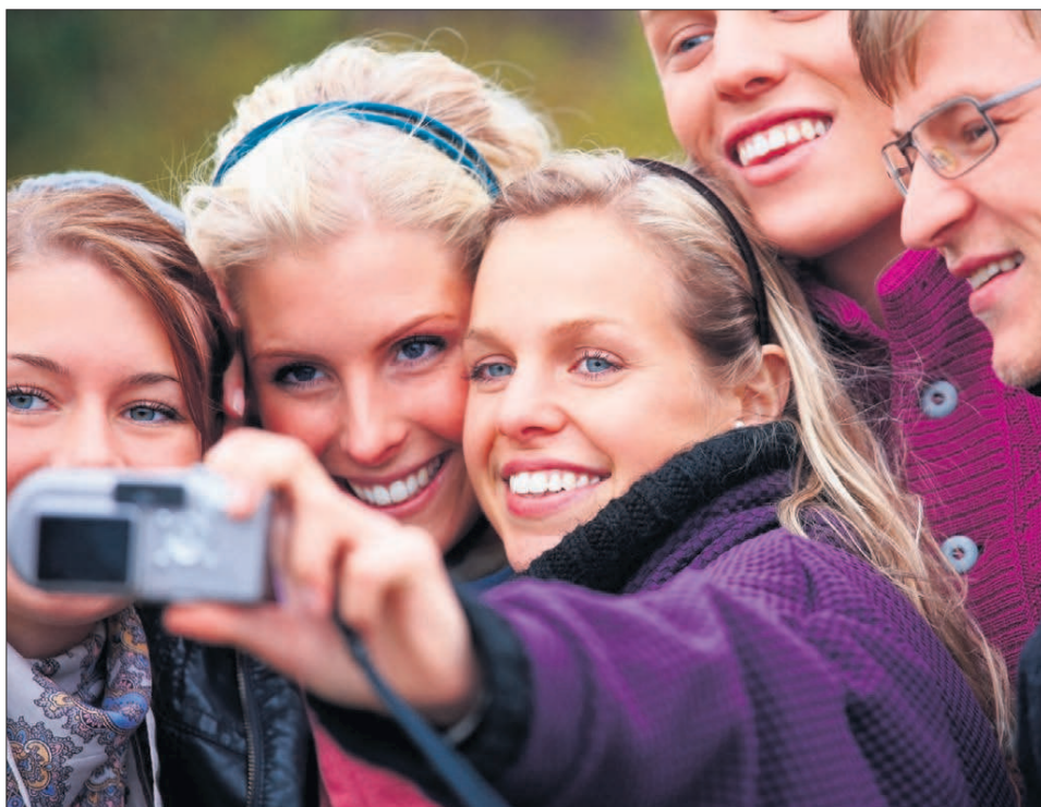
Roczna przerwa w nauce to zazwyczaj przygoda, poznanie innych kultur i międzynarodowe znajomości

Na gap year decydują się osoby, które po studiach nie chcą jeszcze rozpocząć życia zawodowego lub w trakcie studiów decydują się na urlop dziekański, aby spełnić marzenia o podróżach. Często są to też maturzyści, którzy przed rozpoczęciem nauki na uczelni chcą zasmakować wolności.